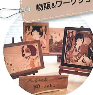
木の香り工房「朔」 マーケットリーアート(寄木の絵画)