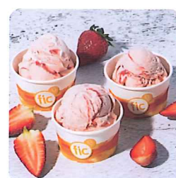
デイスービスおとは